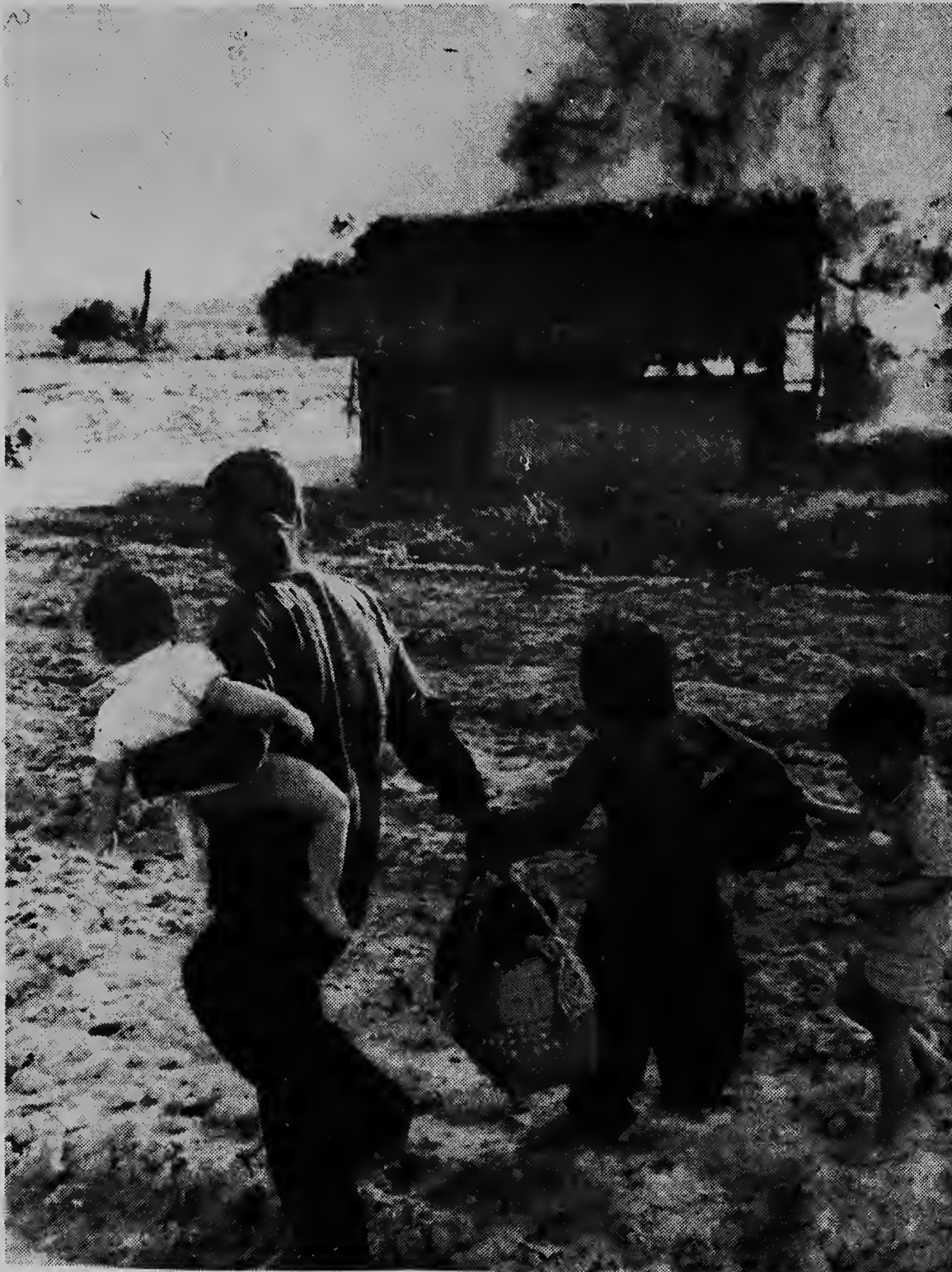
Un mama vietnames ta hui cu su jiuinan for di un pueblo serca e frontera cu Cambodja.

Hombiernan rana lo vigila e bapor Ruso tanten cu e ta den haaf di Kopenhagen.